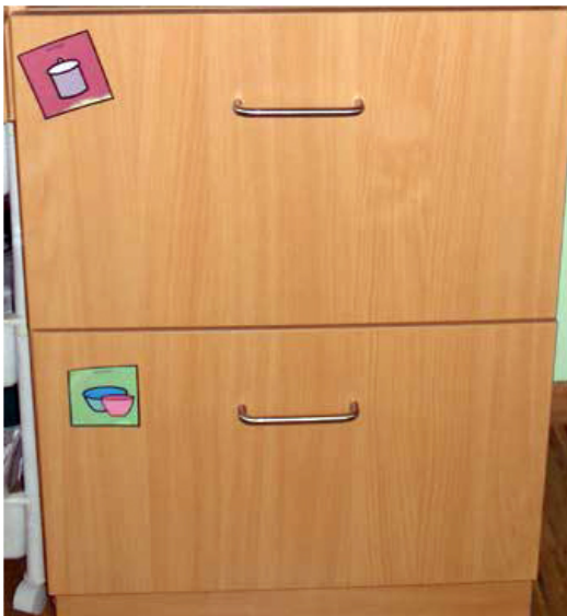
Abb. 2: Bildsymbole machen schon von außen deutlich, was sich in den Schränken befindet.