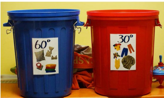
Abb. 1: Auf den Wäschetonnen sind bildhafte Erklärungen eine echte Unterstützung.

Die Orientierung im Raum wird durch räumliche Strukturierung (vgl. strukturierte Arbeitsplätze) erleichtert. Dazu können eindeutige Anordnungen von Möbeln ebenso beitragen wie Farbkodierungen, Bebilderungen, Beschriftungen oder Fotopläne.