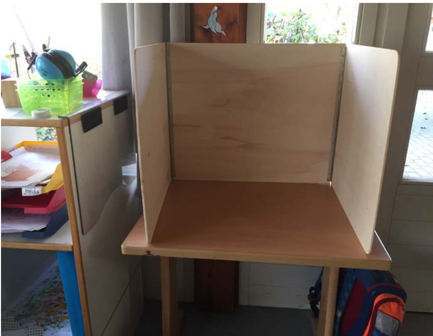
Abb. 4: Ein Arbeitsplatz, der durch eine Holzabtrennung Ablenkungsschutz bietet