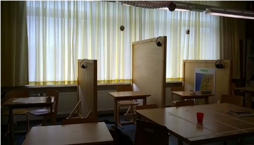
Abb. 3: In diesem Klassenzimmer gibt es gleich drei abgetrennte Arbeitsplätze, die Ablenkungsschutz bieten.