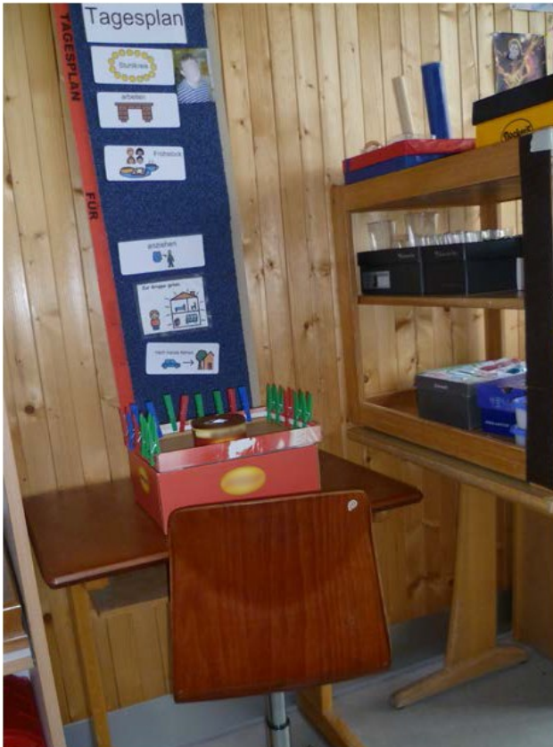
Abb. 1: Über dem Arbeitsplatz gibt der Tagesplan mit Symbolen eine ständige visuelle Unterstützung