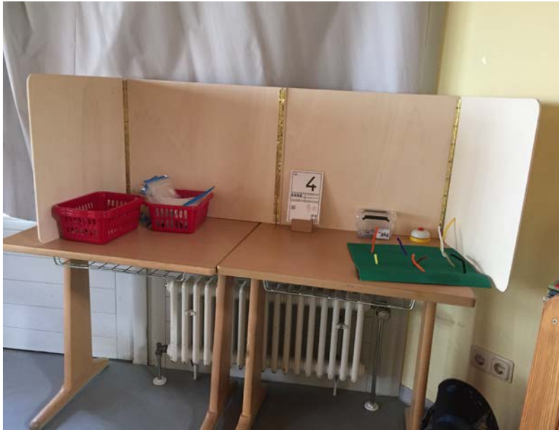
Abb. 5: Die Abtrennung an diesem Arbeitsplatz umfasst einen größeren Arbeitsraum.