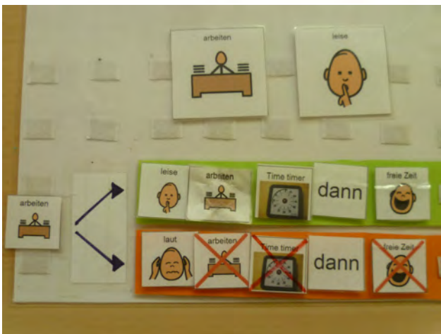
Abb. 7: Über Alternativenpläne werden die Folgen des eigenen Handelns bildlich sichtbar gemacht.