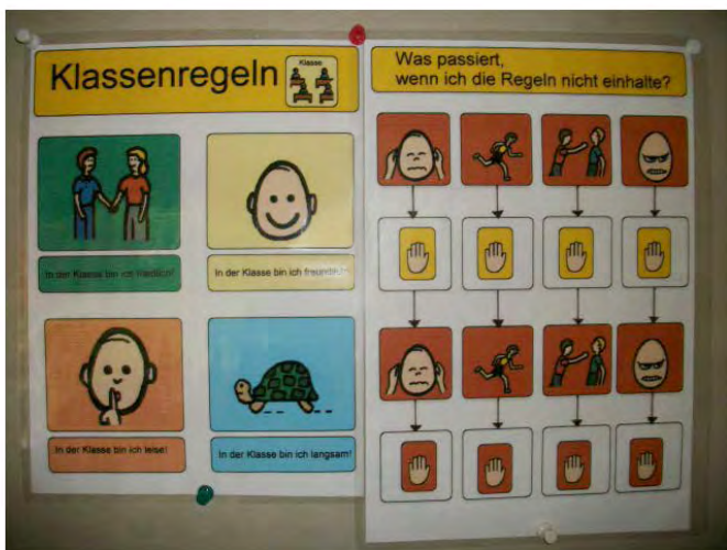
Abb. 4: Sowohl die Regeln als auch die Konsequenzen ihrer Nichtbefolgung lassen sich symbolhaft gut darstellen.