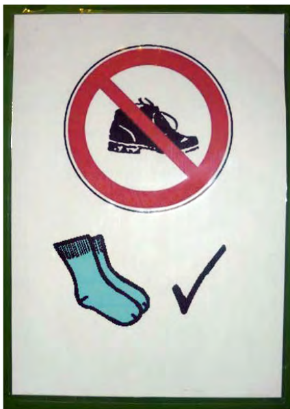
Abb. 1: Dieses Bild vor dem Sportbereich zeigt, dass hier keine Straßenschuhe erwünscht sind.

Auch im Bereich der sozialen Kompetenzen lassen sich visuelle Unterstützungssysteme einsetzen. Klassenregeln können bildhaft dargestellt werden, Alternativpläne die Konsequenzen des eigenen Verhaltens aufzeigen und soziale Skripts (social stories) Verhaltensnotwendigkeiten erläutern.