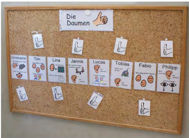
Abb. 6: Dieser Plan verdeutlicht Verhaltensregeln für einzelne Schüler und belohnt Erfolge mit einem Daumenzeichen.