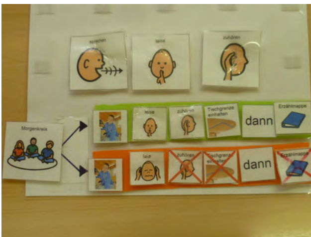
Abb. 8: Ein weiteres Beispiel für einen Alternativenplan.