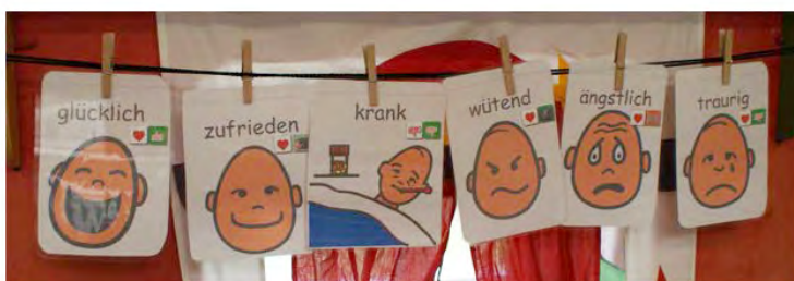
Abb. 5: Gefühlkarten helfen dabei Emotionen zu erkennen und zu verstehen.